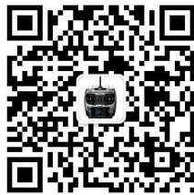
乐迪微信公众平台

建议：在您阅读本说明书时，请打开遥控器和接收机并将接收机连接舵机等相关设备，边阅读边操作。您在阅读这些说明时，如遇到困难请查阅本说明书或致电我们售后（0755-88361717）及登陆我司官网或交流平台（ www.radiolink.com.cn ，乐迪官方群，乐迪微信公众平台）查看相关问题问答。