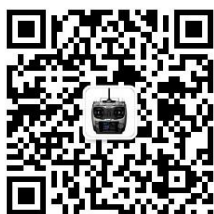
乐迪微信公众平台

建议：在您阅读本说明书时，请打开遥控器和接收机并将接收机连接舵机等相关设备，边阅读边操作。您在阅读这些说明时，如遇到困难请查阅本说明书或致电我们售后（0755-88361717）及登陆我司官网或交流平台（www.radiolink.com.cn，乐迪官方群，乐迪微信公众平台）查看相关问题问答。